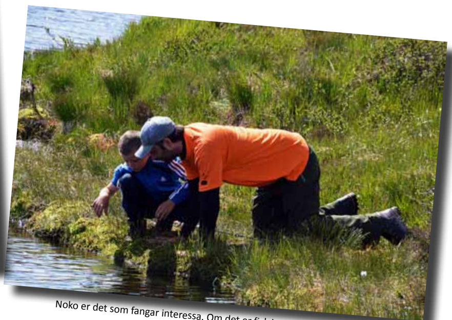
Noko er det som fangar interessa. Om det er fisk kom den ikkje på land.