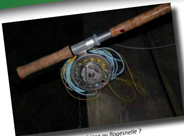
Kanskje kjøpe ny flogesnelle ?