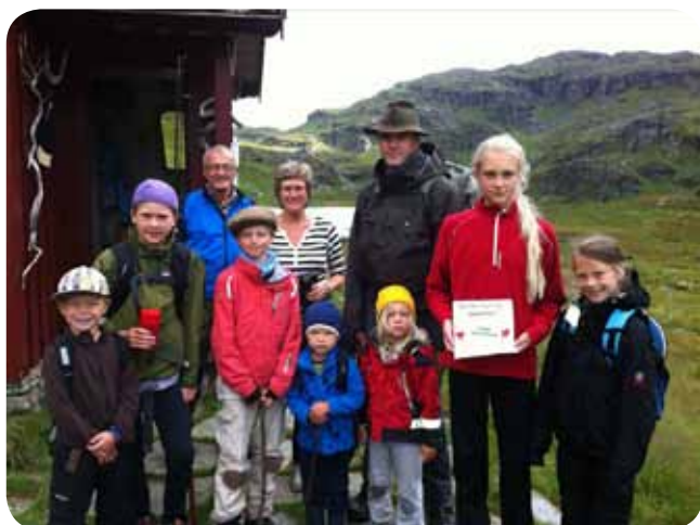
Gjengen på Kvamstølen.