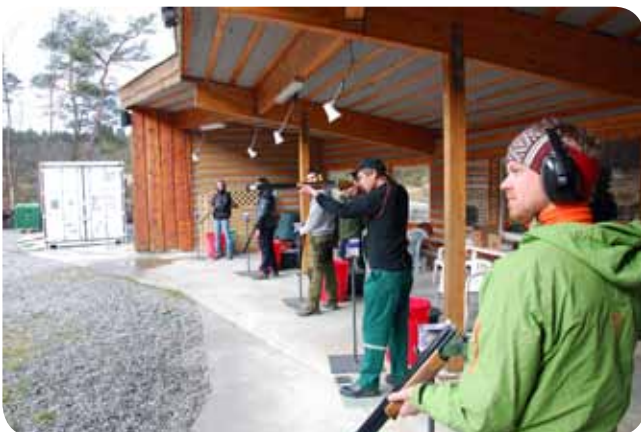
I aksjon på Jegertrapbanen med hagler kjøpt av gåve frå Etne sparebank.