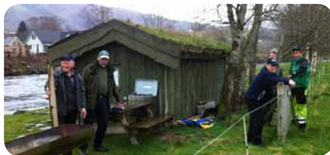
Dugnadsgjengen i sone 3.

For å få alt klart til fiskestart måtte vi i gang med en god dugnadsinnsats for å få sone 2,3 og 10 like fine og koselige som før elva ble stengt. Det var ikke gjort noe på disse to åra, så behovet for en opprydding var stor. Fiskebuer ble beiset, utedoer ble tømt og satt i stand, gras ble slått, og busker og kratt ble hogd. Dette er imidlertid et lystbetont arbeid, og vi hadde mange artige stunder i elva. Når fiskerne kommer, og vi får ros og skryt for hvor fint vi har det i våre tre soner, er det betaling god nok. Dessuten så selges stort sett alle fiskedøgn år etter år, ikke bare fordi det er gode fiskesoner, men også fordi folk koser seg og har det kjekt.