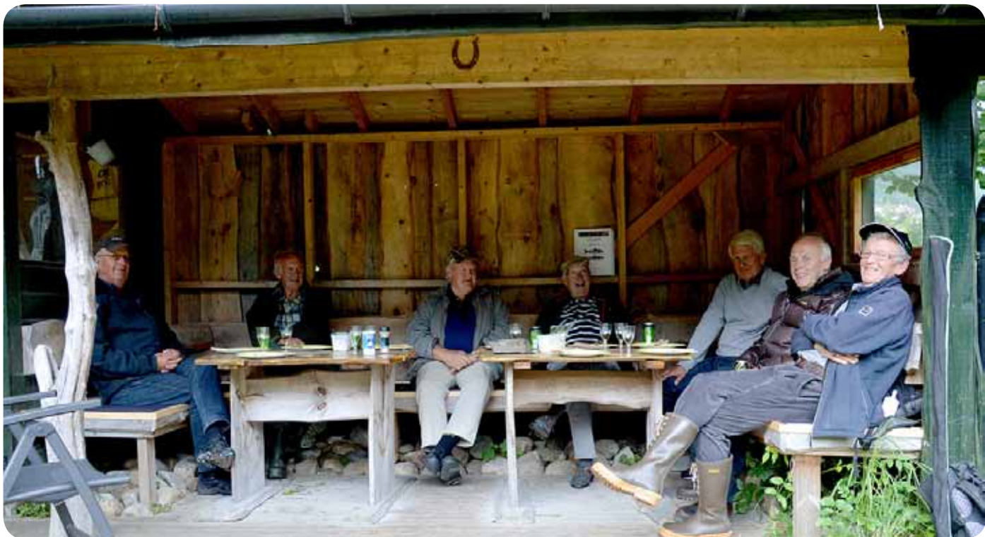
"Gamle" karane samla i sone 2.

Dette har blitt et populært treff for den eldre garde i foreningen. I år var vi samlet til god mat og sosialt samvær i sone 2. Her ble det servert grillet entrecôte, poteter og grønnsaker, samt en nydelig dessert. Dette ble levert av Mathuset. Det var øl og vin til maten, og etterpå kaffe og cognac, pluss mange gode historier.