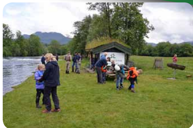
Oppmøtet var gjennom dagen bra og fisk vart det ! ... for nokon..