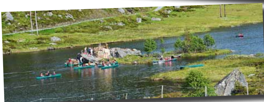
Camp Hjørnås: Stor kanoaktivitet i Hjørnåsvatnet.