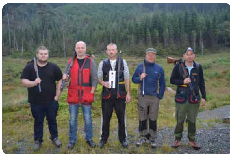
Finalelaget klubbmeisterskapen - 50 skot Jegertrap