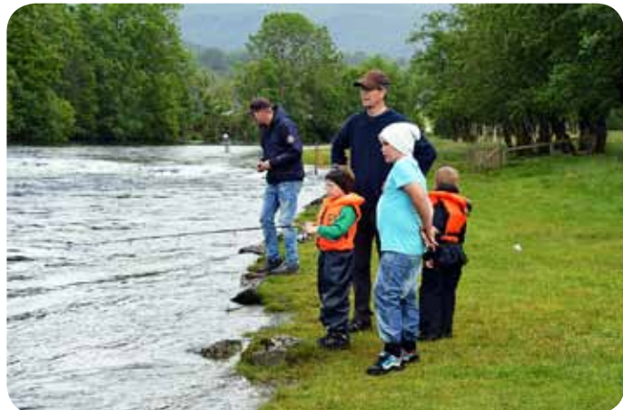
Mon tru dei speidar etter fisk ?