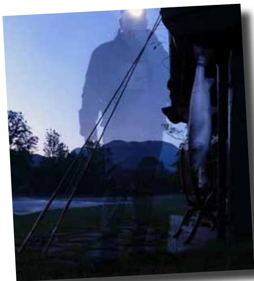
Spøkelset i sone 3.