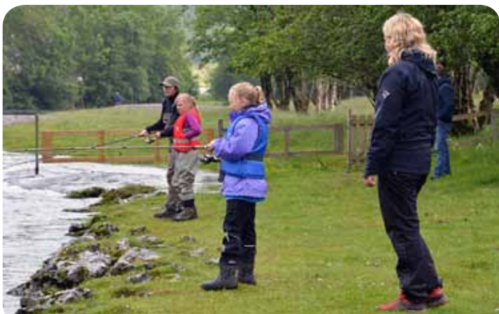
Det er kjekt å sjå at ungane vil læra seg å fiske.

Den 24.06. kl. 13.00 – 17.00. var det klart for juniorfiske i sone 3 – eit tilbod fleire nytta seg av. Med kjempe forhold låg alt vel til rette for god fangst. Det vart det også: 1 laks på 6,4 kg og 1 tert på ca. 2 kg. Samt at det vart mista ein på ca. 7,5 kg.