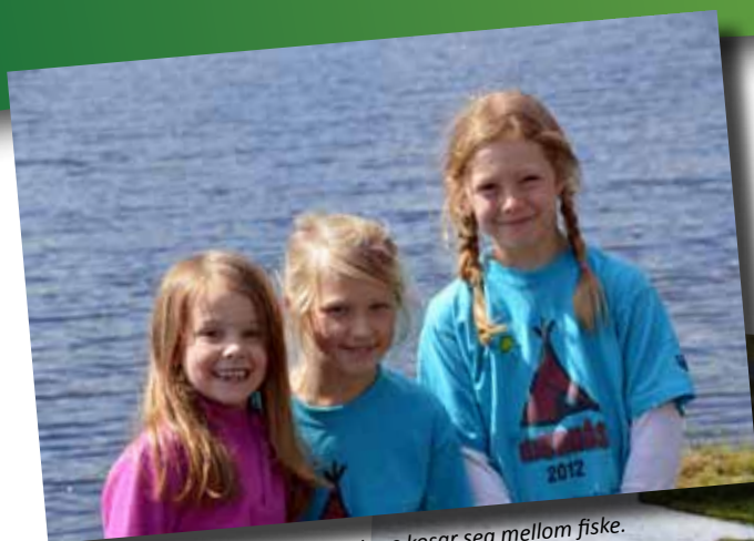
Camp Hjørnås: Jentene kosar seg mellom fiske.