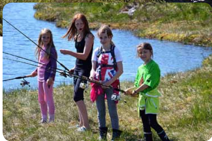
Camp Hjørnås: Eit firkløver med optimistiske fiskarar.