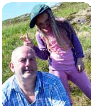
Camp Hjørnås: Litt lott og løye er lov.