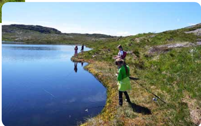
Camp Hjørnås: Mens det framleis er håp ...