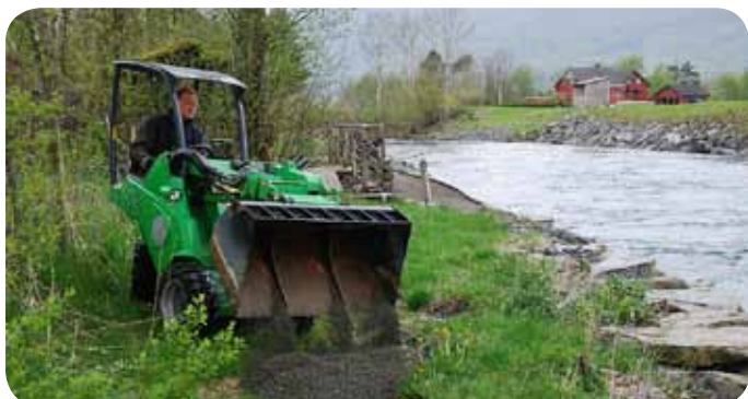
Geir Grindheim kjører på ny grus i stien på sone 10.