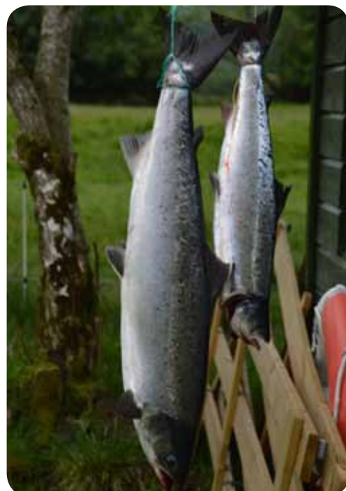
Fangsten søndag 24.06.

Etter fiske fekk kvar av barna, som ikkje hadde fått stang i fjor, eit fiskesett (stang og slukboks) av Etne JFF. Vi delte ut ca 70 sett. Ein stor takk til lederar som var med og såg til at det vart ei god oppleving for barna. Vi merka oss stor framgang i kasteteknikk hos mange av barna.