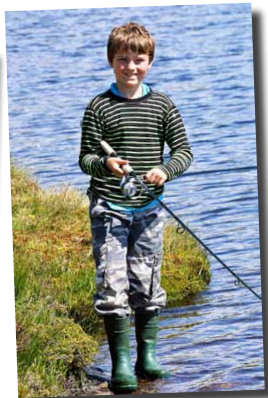
Camp Hjørnås. "Dette likar eg!"