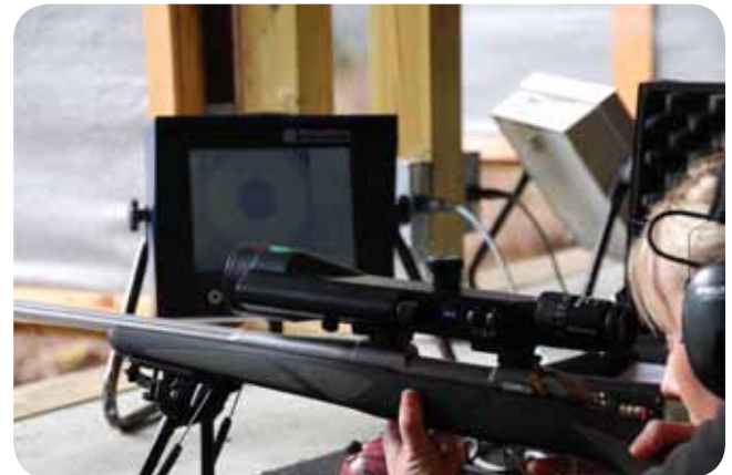
I djup konsentrasjon på riflebanen.

Gjennomsnittsalderen på deltakerane var 21 år. 3 damer gjennomførte kurset.