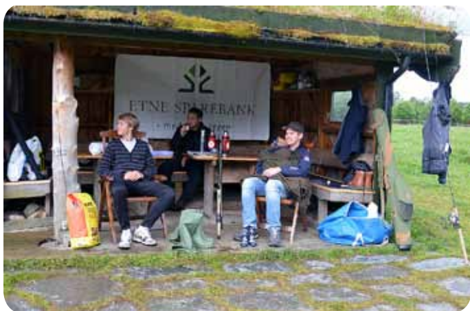
Ein kaffepause for store og små i sone 3.