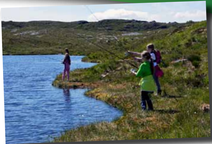
Camp Hjørnås: Fiskelykke...