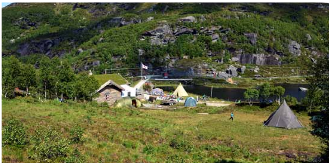
Camp Hjørnås: Basecamp